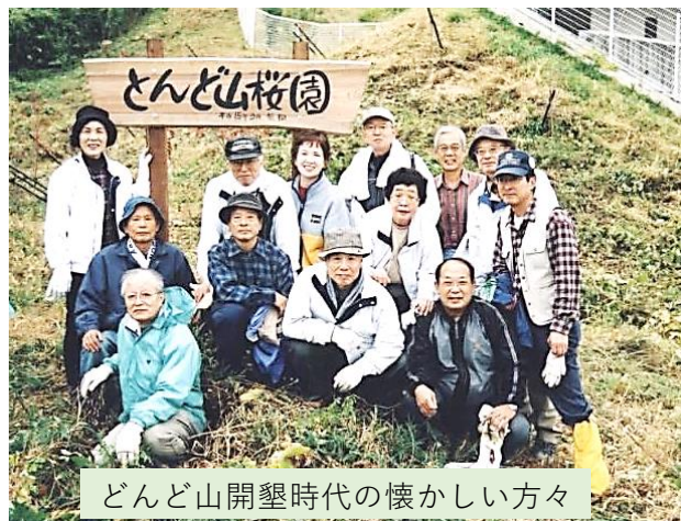
とんど山開墾時代の懐かしい方々