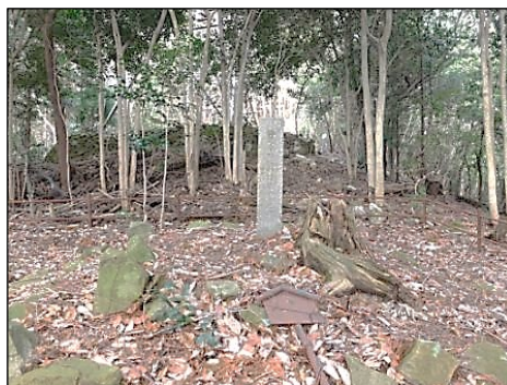
【八天の石蔵の場所標記】

麓にある村々との境界紛争が解決した寛喜二年(1230)に勝尾寺が八か所に勝示(境界線)を設け、勝示の東西南北には四天王像を、その中間には四明王像を30cm程の容器に入れ埋められたものです。古文書を参考にし、昭和37~8年の調査で発見され、各像と容器は勝尾寺に保管され重要文化財に、場所は国の史跡に指定されている。その場所には現在 八天の石蔵の場所として表記された碑が建てられている。