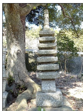
【光明天皇 77日忌 七重石塔】