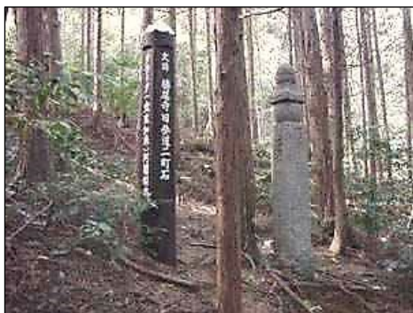
【勝尾寺表参道 1町石】

現在の箕面市新家の大鳥居から勝尾寺山門までの参道の三十六町(約4km)に一町毎に町石(町卒塔婆)が建てられ、現在20基が残り、その内「下乗石から七町石までの8基」が日本最古(宝治元年1247年造立)の町石として国の史跡に指定されています。高さ150cmの角柱の上に五輪の塔が積み上げられた立派な塔です。