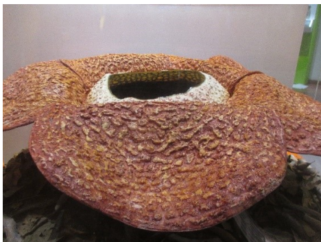
【世界最大の花 直径 80cm(ラフレシア)】

光合成という、太陽エネルギーから有機物を作り出す能力を手に入れたことで、地球上の生命にとってなくてはならない存在となった植物。私達人間と同様に微生物から次々と進化して行き、相互に補完しながら進歩を遂げていく姿は全くの驚きでした。じっと動かない植物が、様々な工夫で種の保存を図っていく生きざまが、恐ろ