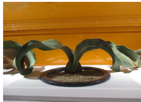
【ウエルウイツア(サバクオモト)】