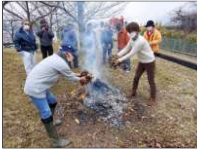
消防自動車2台・消防団員十数名 ・ナルク会員15名の参加でした

芋は昨今品種が改良されて、この日の焼き芋の味は最高級の栗の味を超えていたに違いない。